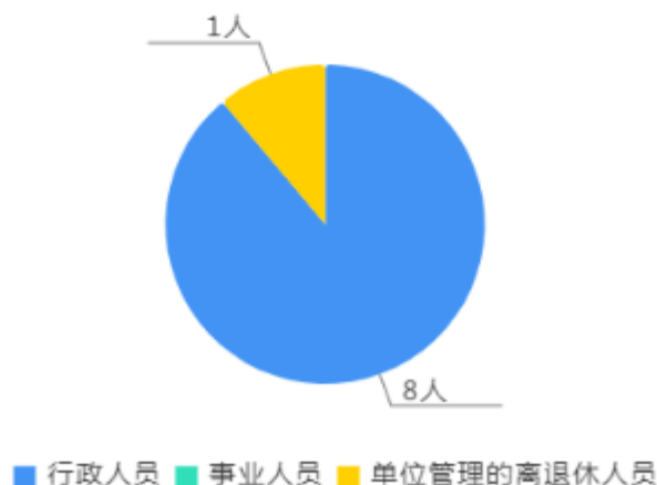
人员情况构成饼图